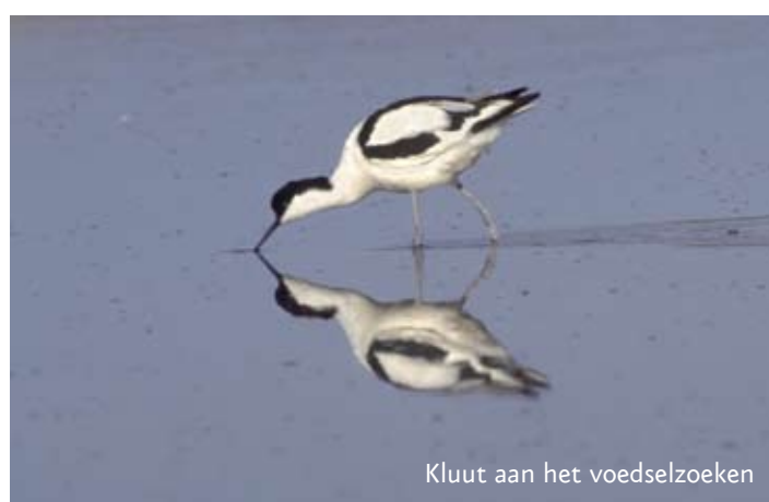
Kluut aan het voedselzoeken