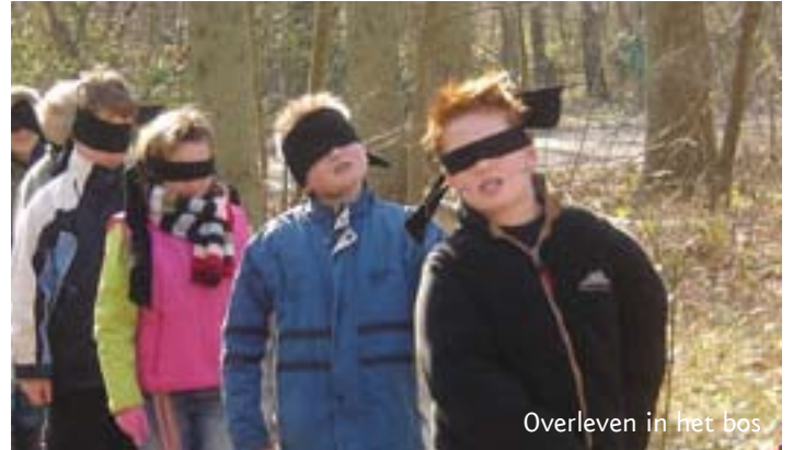
Overleven in het bos

Ervaar het echte wadgevoel tijdens het wadlopen. Ontdek het leven in en op het wad. Verdieping in de ecologie van de Waddenzee.