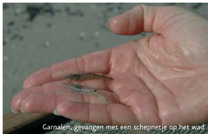
Garnalen, gevangen met een schepnetje op het wad

Kijk op onze website voor meer informatie.