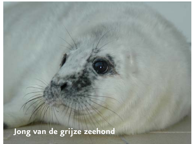
Jong van de grijze zeehond

Het opvangen van zeehonden op Texel is begonnen in de jaren '50 toen het heel slecht ging met deze dieren. De gedachte achter de opvang was de zeehond als soort te helpen, door zieke en verzwakte dieren weer beter en sterk te maken en terug in zee te zetten. Tegenwoordig gaat het gelukkig zo goed met de zeehond dat de soort zichzelf wel in stand zal houden, zelfs als er een ziekte uitbreekt. Opvang van zeehonden is gelukkig niet meer nodig om zeehonden voor uitsterven te beschermen.