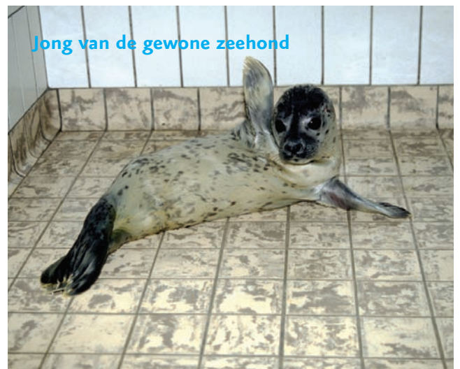
Jong van de gewone zeehond