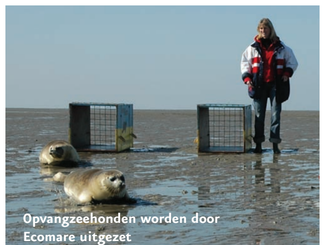
Opvangzeehonden worden door Ecomare uitgezet